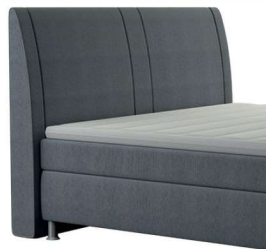
0050 Höhe 117 cm Standard