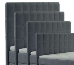
0046S - Höhe 99 cm 0046M - Höhe 109 cm 0046L - Höhe 119 cm 0046XL - Höhe 129 cm gegen Aufpreis