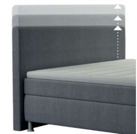
0300 Multimaß Höhe 80 - 125 cm in 5cm-Schritten kürzbar gegen Aufpreis