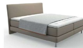
Typ 100 Plaid Klassik komplett geöffnet deckt die Liegefläche nicht ab.

Bitte bei Bestellung (vor allem Einzel- oder Nachbestellung) immer die Bettmaße angeben. Die angegebenen Maße sind ca. Maße. Geringfügige Maßabweichungen zur Liegefläche plus Volanthöhe sind produktionsbedingt