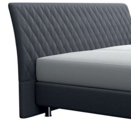
0354 Höhe 116 cm gegen Aufpreis