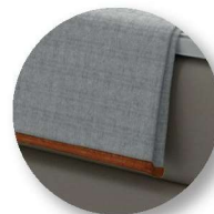
Typ 100 Plaid Klassik Kanten mit Einfassband paspeliert