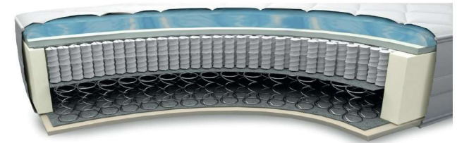
MA760GA gegen Aufpreis