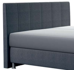
0320 Höhe 115 cm gegen Aufpreis